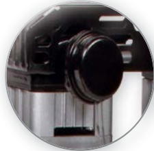
Cabeza Libre de Aceite CON CILINDRO DE ALUMINIO ANODIZADO DURO