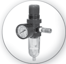
Filtro Regulador de Aire PARA SÓLIDOS EN SUSPENSIÓN MAYORES A 5 MICRONES