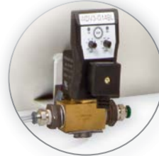
Purga de Aire AUTOMÁTICA