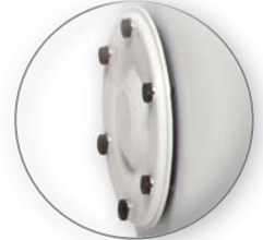
Brida Sellada EL TANQUE ES PINTADO POR DENTRO PARA EVITAR OXIDACIÓN