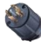
CLAVIJA DE SEGURIDAD.

Con seguro girar-trabar (TWIST LOCK) 3P, 4H, 125/250 V, 30 A Modelo RG-CNL14-30P