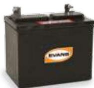
BATERÍA 12 V.

MODELO RBJ-AC906LM PARA GENERADORES PORTÁTILES