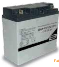
BATERÍA 12 V.

Modelo BAT-EV12V20H para Generadores Portátiles