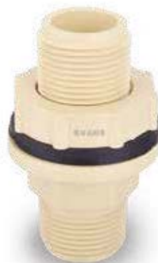
NIPLA DE TANQUE CPVC