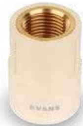
1/2" a 1"