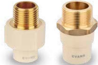
1/2" a 1"

En la tubería CPVC se utiliza la relación de dimensión estándar SDR (Standard Dimension Ratio) por sus siglas en inglés, para evaluar la resistencia del termoplástico sometido a presión. Entre menor sea el valor SDR tendrá mayor capacidad de soportar presión; debido a que existe un mayor espesor entre el diámetro interno y el diámetro externo del tubo.