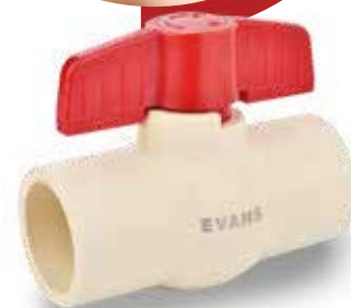
VÁLVULA BOLA CPVC