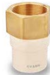
1 1/4" a 2"