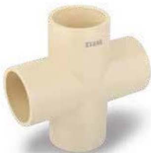
TEE 4 VÍAS CPVC